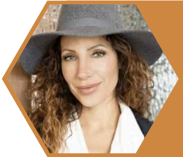
OLGA LOUNOVÁ ZPĚVAČKA

Populární česká zpěvačka, skladatelka, herečka, závodnice rallye.