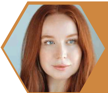
ALENA DOLÁKOVÁ HEREČKA

Populární česká zpěvačka, skladatelka, herečka, závodnice rallye.